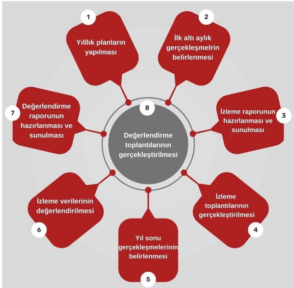
Şekil 4: İzleme ve Değerlendirme Süreci

İzleme ve değerlendirme sürecinin işleyişi ana hatları ile Şekil 4'te özetlenmiştir. Denizli-Çivril Hacı Osman Gümüş Anaokulu Müdürlüğü 2024–2028 Stratejik Planı'nda yer alan performans göstergelerinin gerçekleşme durumlarının tespiti yılda iki kez yapılacaktır. Ara izleme olarak nitelendirilebilecek yılın ilk altı aylık dönemini kapsayan birinci izleme kapsamında, MEM Stratejik Plan İzleme ve Değerlendirme Modülü vasıtasıyla, harcama birimlerinden sorumlu oldukları performans göstergeleri ve stratejiler ile ilgili gerçekleşme durumlarına ilişkin veriler toplanarak konsolide edilecektir. Performans hedeflerinin gerçekleşme durumları hakkında hazırlanan "Stratejik Plan İzleme Raporu" Müdür ve kurum içi paydaşların görüşüne sunulacaktır. Bu aşamada amaç, varsa öncelikle yıllık hedefler olmak üzere, hedeflere ulaşılmamasının önündeki engelleri ve riskleri belirlemek ve yıllık hedeflere ulaşılmasını sağlamak üzere gerekli görülebilecek tedbirlerin alınmasıdır. Yılın tamamına ilişkin ikinci izleme kapsamında ise MEM Stratejik Plan İzleme ve Değerlendirme Modülü vasıtasıyla, tarafından harcama birimlerinden sorumlu oldukları performans göstergeleri ve stratejiler ile ilgili yıl sonu gerçekleşme durumlarına ait veriler toplanarak konsolide edilecektir.